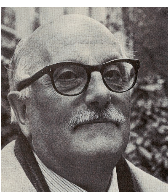
Jean Tardieu en 1984